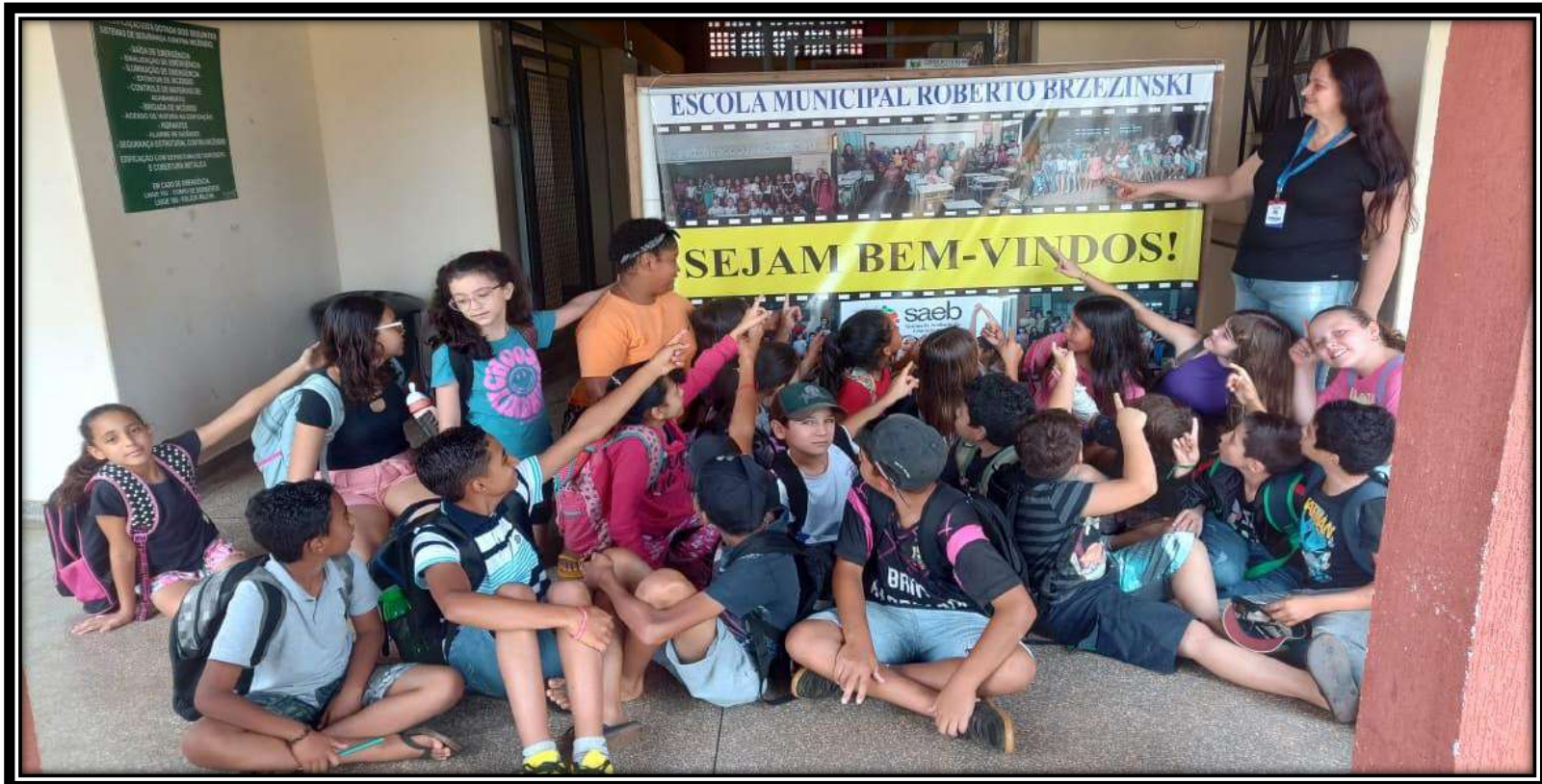
Prova SAEB: recepção aos alunos