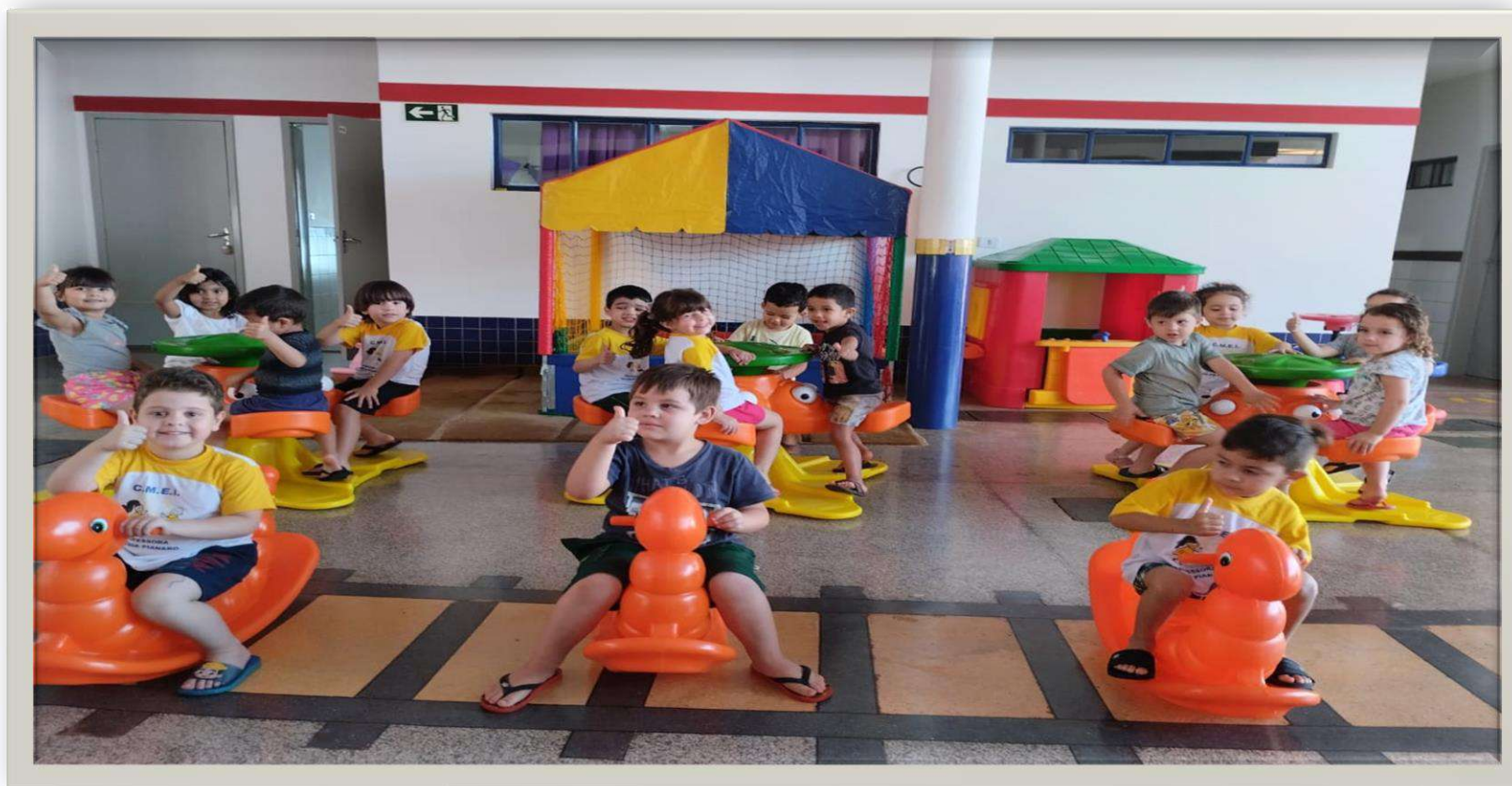
Brinquedos nos CMEIs