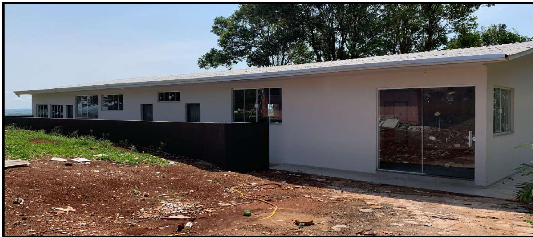
Reforma do CMEI Bom Menino (Distrito de Bela Vista do Piquiri)