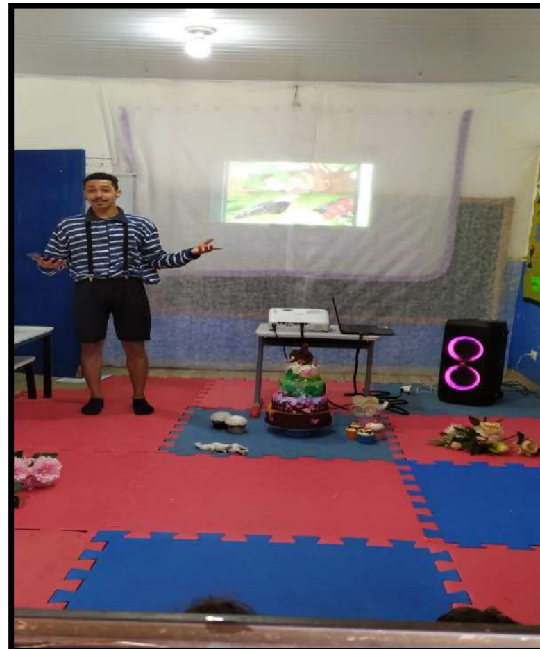
Contação de histórias na Educação Infantil