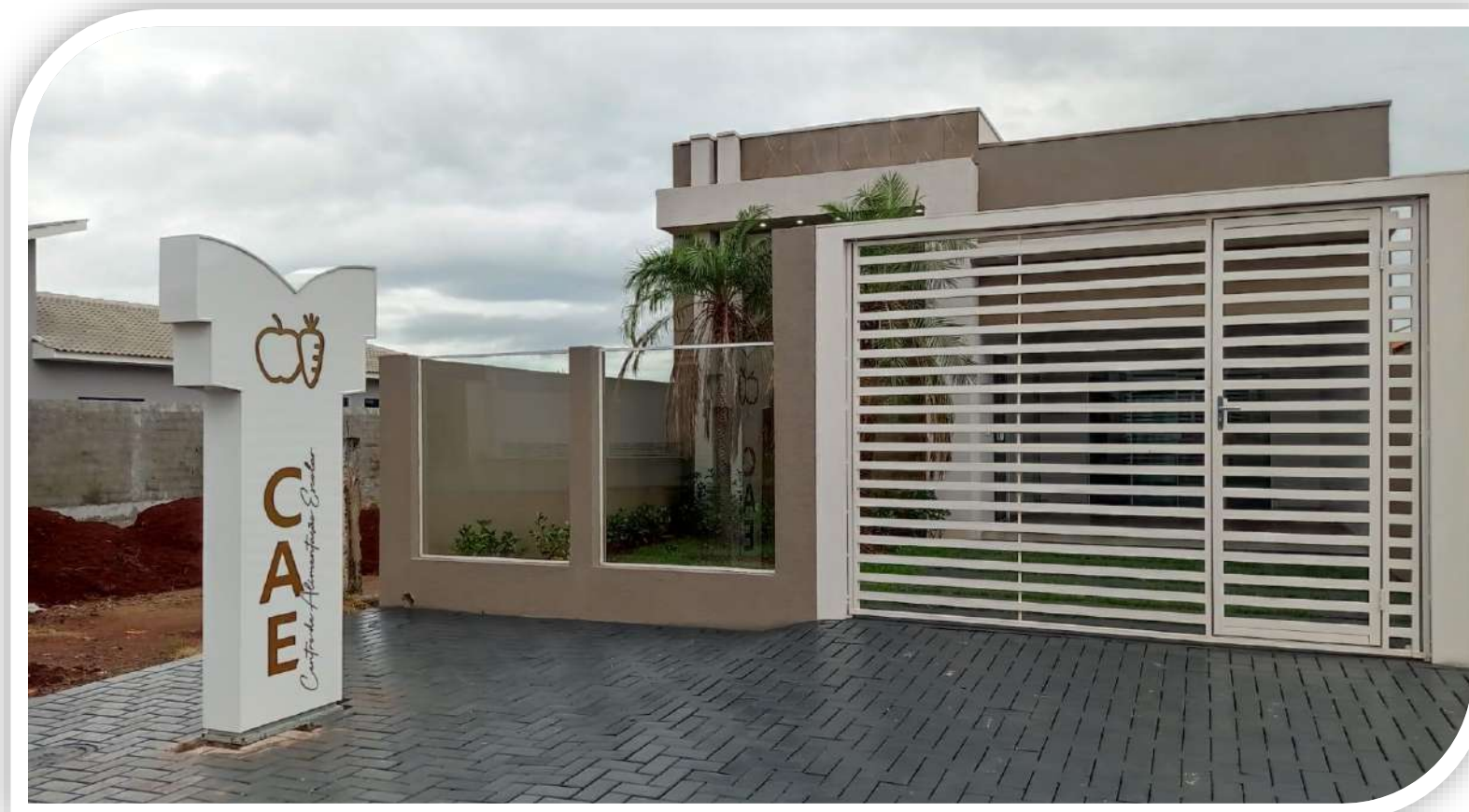
Centro de Alimentação Escolar