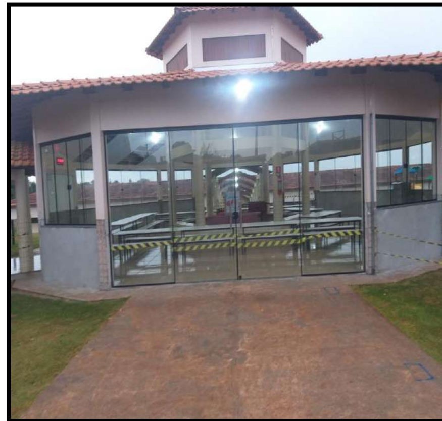
Fechamento do refeitório com portas e janelas de vidro Escola do Campo Floriano Peixoto (distrito de Salles de Oliveira)