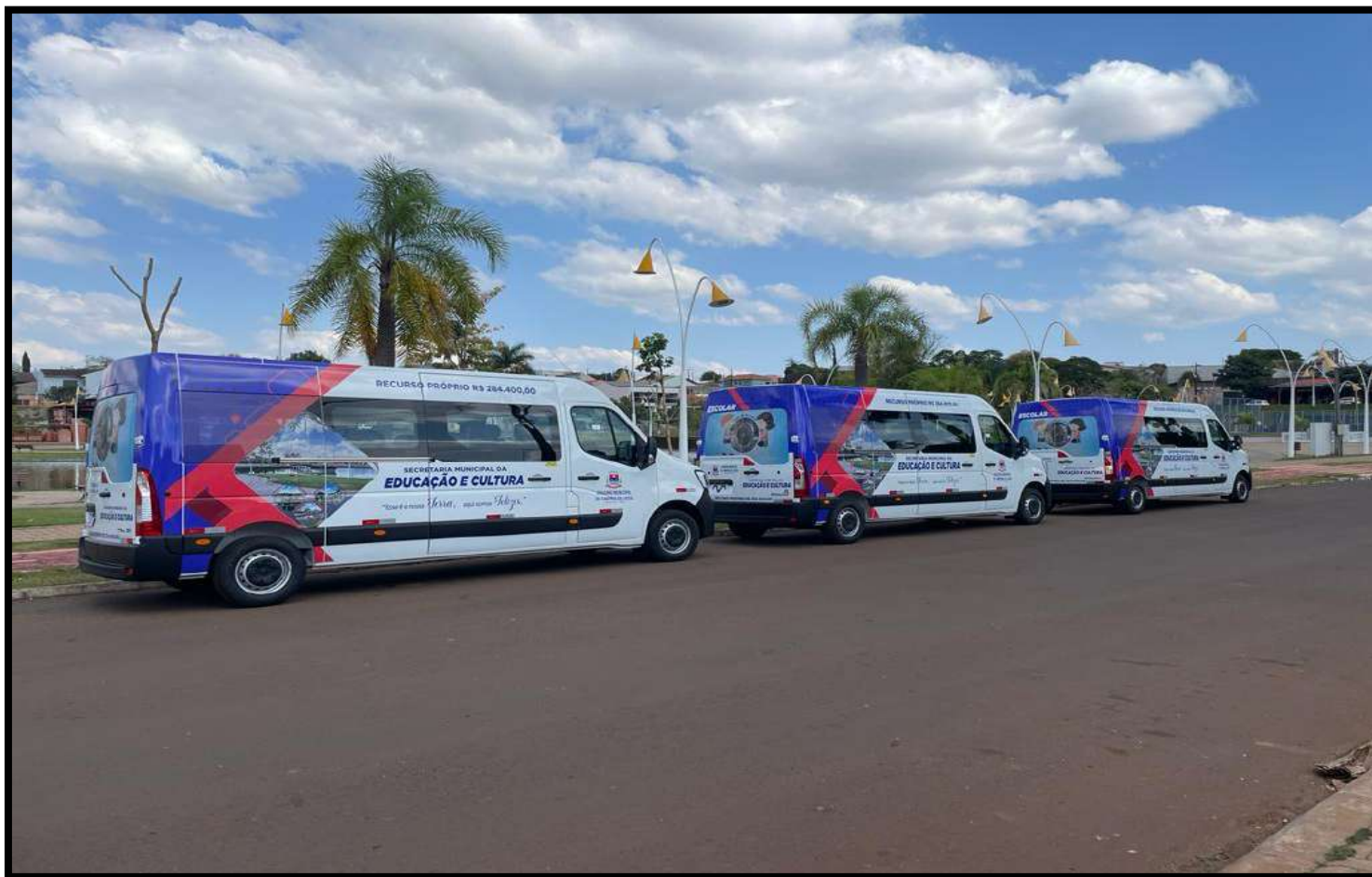
Aquisição de Vans para o Transporte Escolar