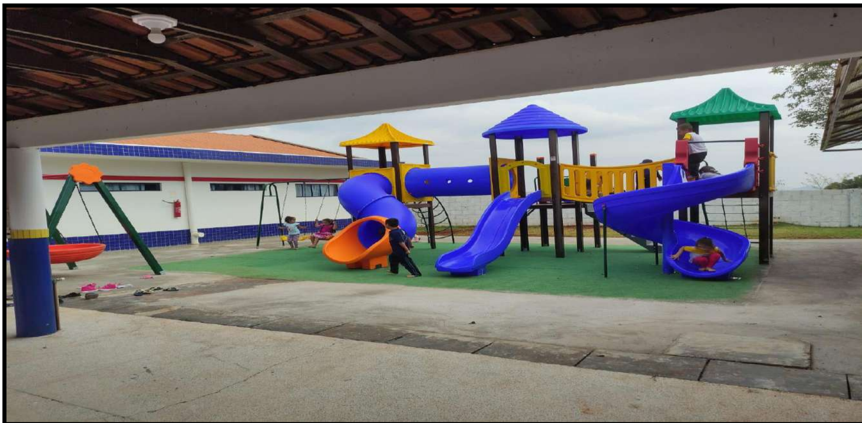
Parquinho do CMEI Professora Valéria Pianaro