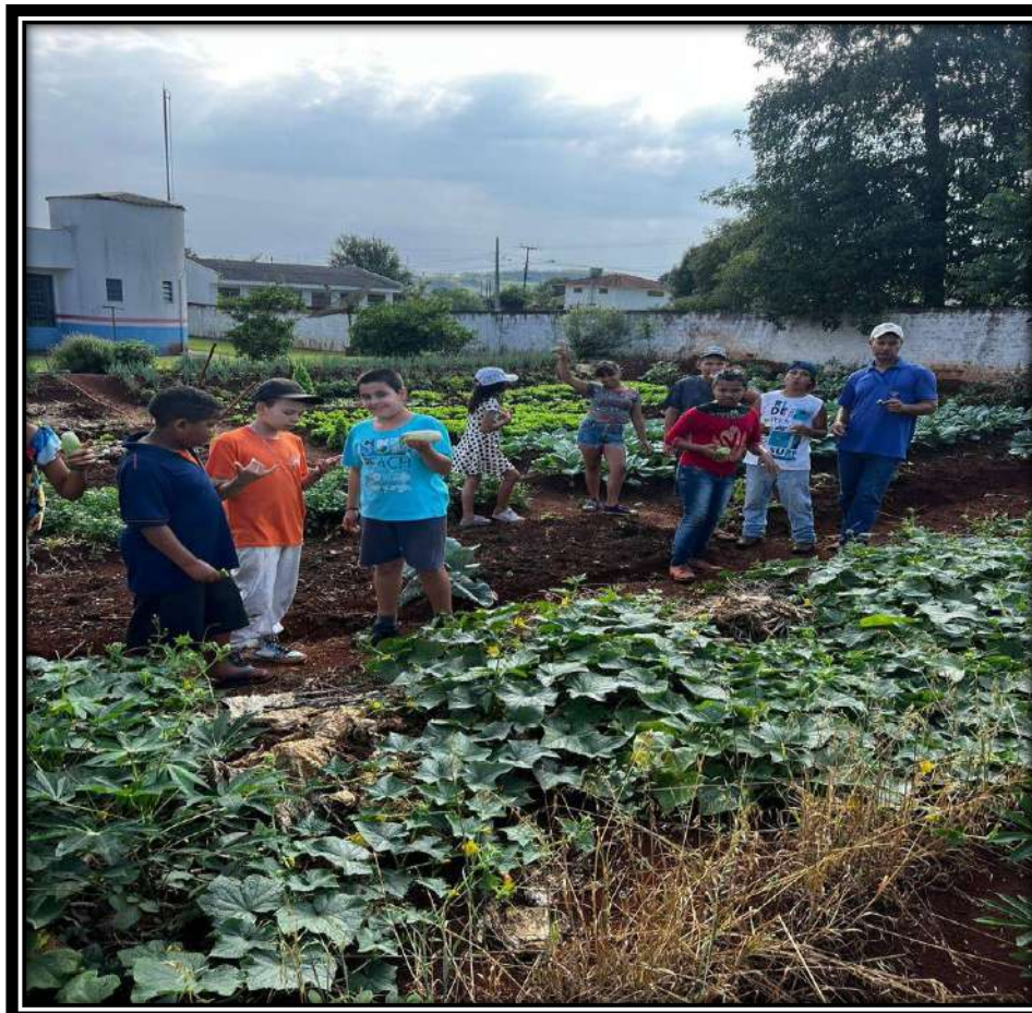
Horta Escolar: Escola Municipal do Campo Floriano Peixoto