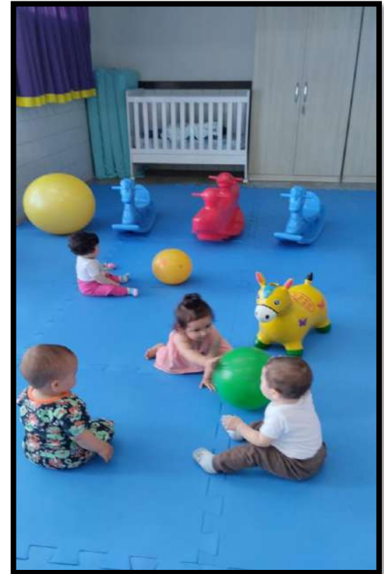
Brinquedos nos CMEIs