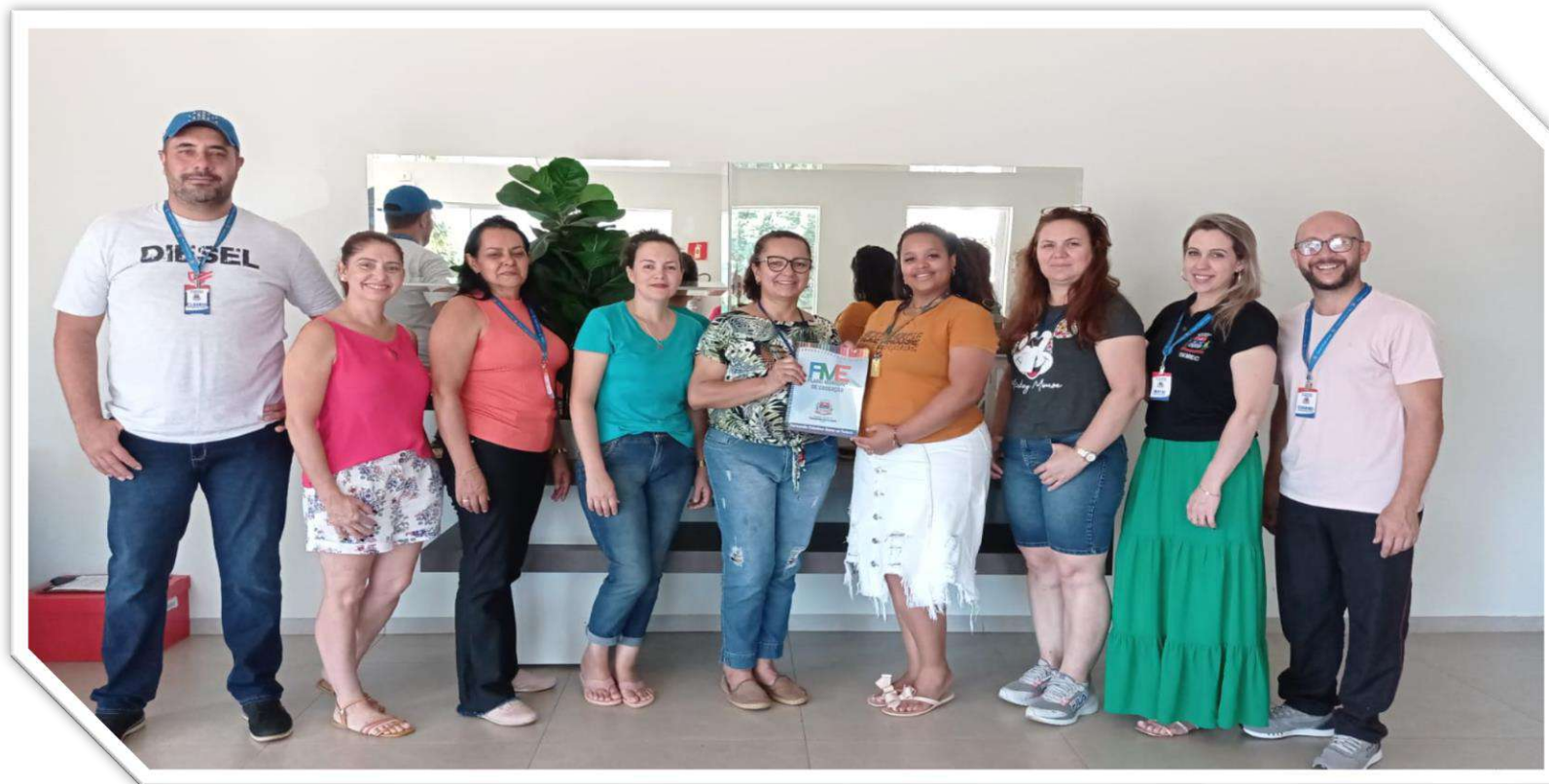
Foto da Reunião de apresentação do monitoramento do PME Comissão Coordenadora e Equipe Técnica.