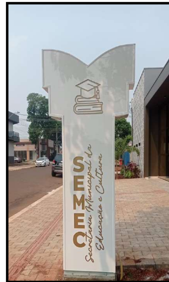
Secretaria da Educação e Cultura