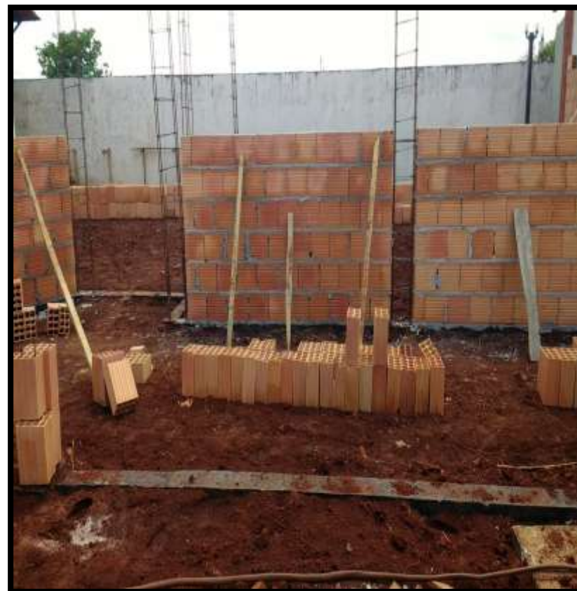
Construção de duas salas de aula na Escola Municipal Roberto Brzezinski.