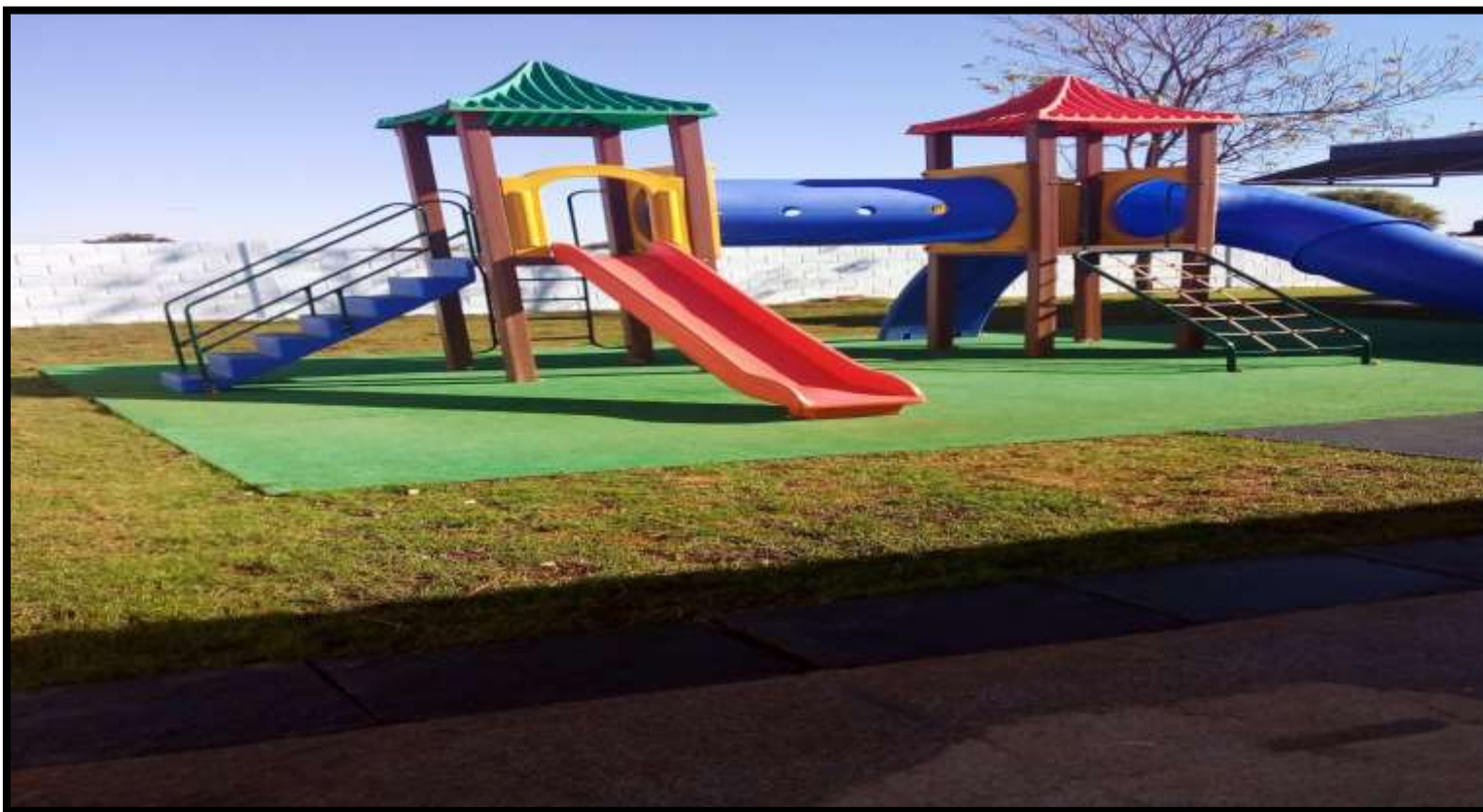
Reativação do parquinho do CMEI Professora Valéria Pianaro.