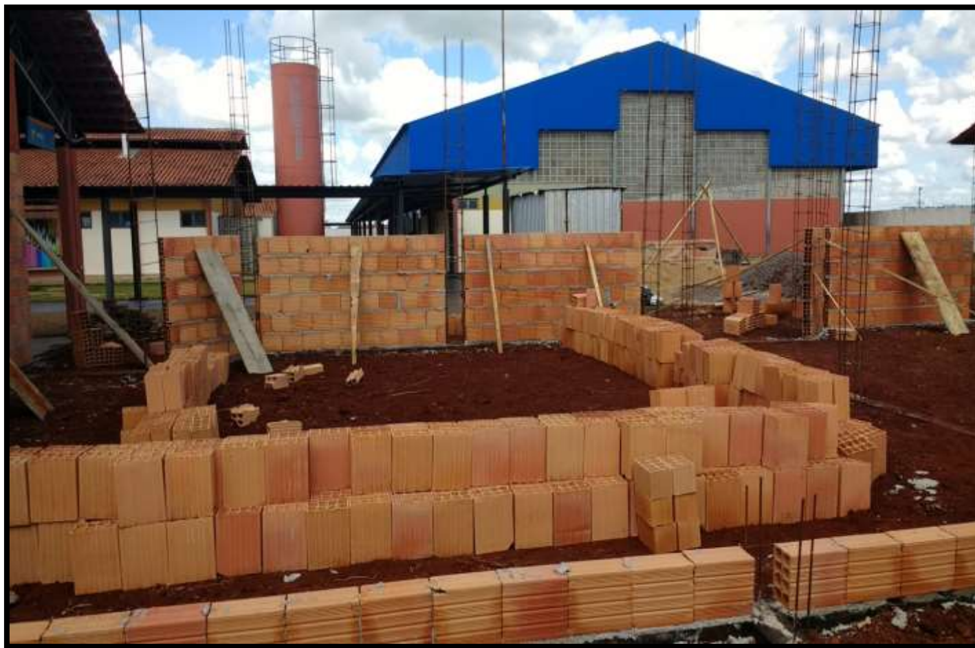
Construção de duas salas de aula Escola Municipal Roberto Brzezinski.