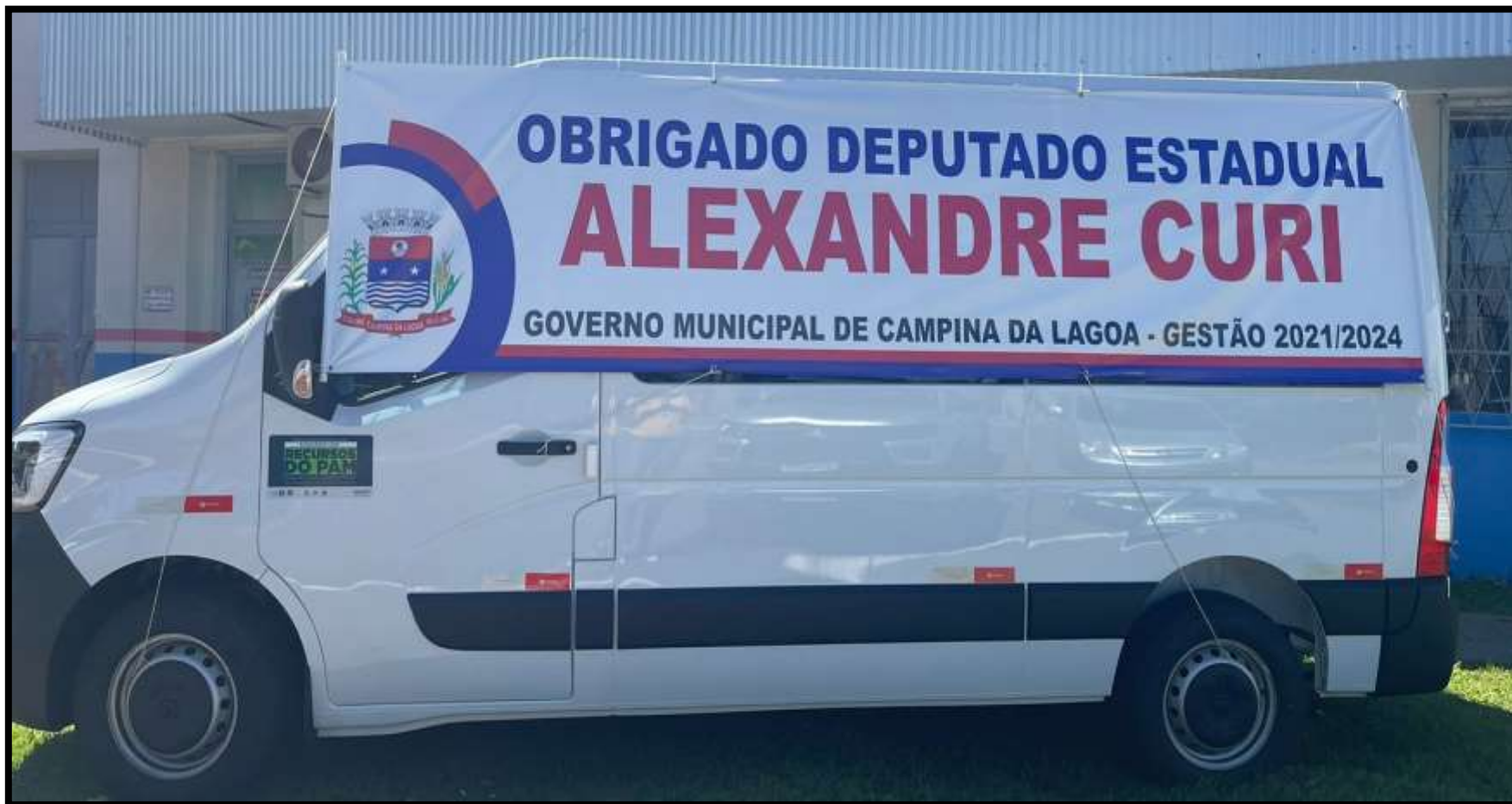
Aquisição de Van