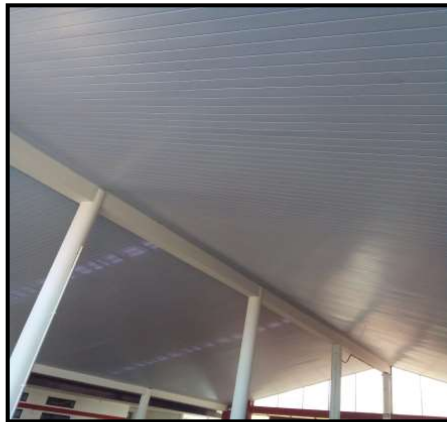
Reformas (forro no refeitório) CMEI Professora Valéria Pianaro.