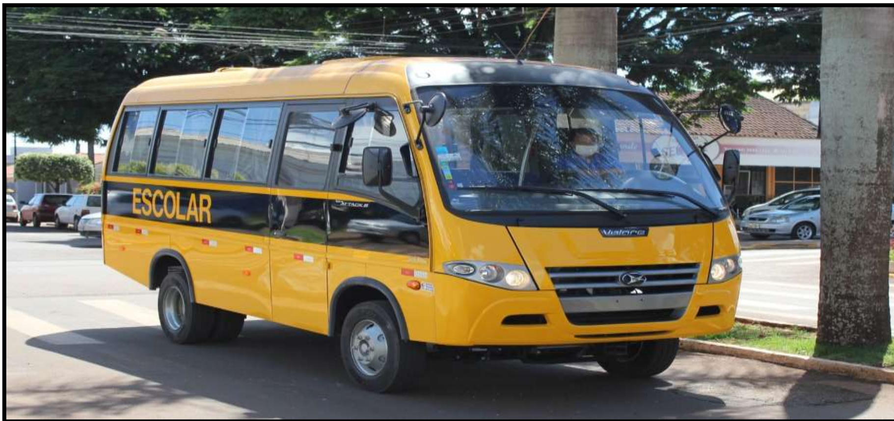
Aquisição de ônibus